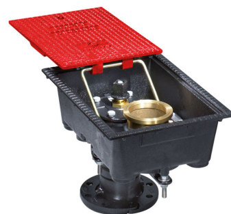
BI 65 mm Débit nominal de 30 m 3 /h