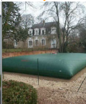
> Citerne souple > Réserve enterrée