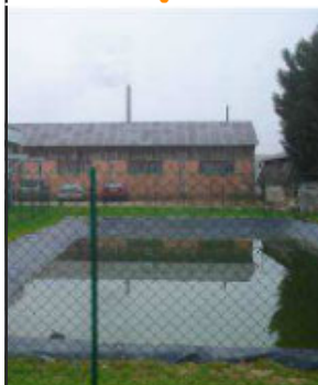
Réserve à ciel ouvert