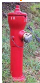
PI 65 mm Débit nominal de 30 m 3 /h