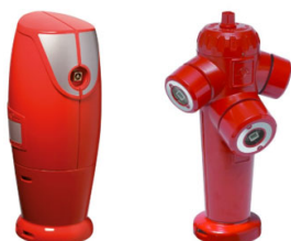
PI 100 mm Débit nominal de 60 m 3 /h