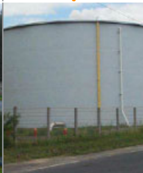
Réservoir aérien fixe